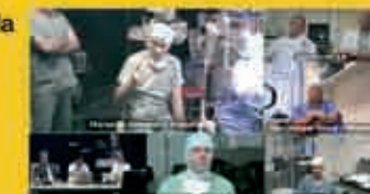
Table ronde multicentrique Hannover, Marseille, Beziers, Manchester, Amsterdam, Londres

Ce r seau permet  galement la formation   distance des internes et chefs de clinique gr ce   une session pilote hebdomadaire de vid o-conf rence entre la clinique Causse et le CHU de Utrecht.