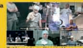
Table ronde multicentre Hannover, Marseille, Beziers, Manchester, Amsterdam, Londres

Ce r seau permet  galement la formation   distance des internes et chefs de clinique gr ce   une session pilote hebdomadaire de vid o-conf rence entre la clinique Causse et le CHU de Utrecht.