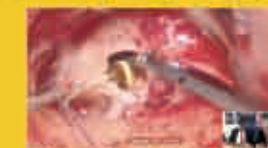
Chirurgie en direct depuis la clinique Causse

Fruit d'une collaboration public-priv , depuis sa cr ation en 2006, le LION a  t  rejoint par plusieurs autres centres d'expertise en Europe et dans le monde tels que Sao-Paulo (Br sil), New York (USA), Bogota (Colombie), Sydney (Australie), Varsovie et Poznan (Pologne), Istanbul (Turquie) y compris du Moyen Orient (Isra el, Jordanie, Egypte, Arabie Saoudite, Syrie etc..).