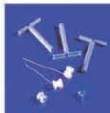
Différents drains trans-tympaniques

Le chirurgien ORL va sélectionner un type de drain adapté à la situation afin qu'il reste en place jusqu'à guérison de l'otite mais également le retour à un fonctionnement normal de la trompe d'Eustache. Ce dernier point peut demander parfois plusieurs semaines ou mois. Pendant ce temps, il est important d'éviter toute pénétration d'eau dans l'oreille car cela pourrait provoquer une nouvelle otite. La pose