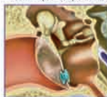
Drain trans-tympanique à-travers le tympan

La plupart du temps, sous traitement bien suivi, l'otite aiguë guérit sans séquelle. Toutefois une paracentèse de drainage peut parfois s'avérer nécessaire. Elle consiste à réaliser une petite incision (ouverture) du tympan pour permettre l'évacuation du pus contenu dans l'oreille moyenne soulageant ainsi rapidement la douleur. Cette ouverture se referme spontanément en quelques jours sans aucune conséquence pour le tympan. En fait, la cicatrisation du tympan est parfois si rapide que celui-ci se referme avant même que le pus soit totalement évacué. Dans ce cas un drain trans-tympanique (diabolo) peut être mis en place dans l'ouverture afin d'éviter que celle-ci ne se referme prévenant ainsi l'accumulation de pus ou de liquide dans l'oreille moyenne.