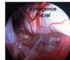
Image endoscopique opératoire montrant l'artère (pica) qui réalise une boucle faisant une empreinte sur la racine du nerf facial.