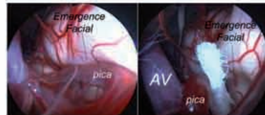
Illustration d'un spasme lié à un conflit provoqué par une artère (pica). A gauche, avant mobilisation artérielle; à droite, après décompression, on visualise nettement l'artère vertébrale (AV), la pica et l'empreinte sur le nerf facial. Un téflon (en blanc) a été interposé de manière à isoler cette zone de conflit.

La microchirurgie permet la mise en place de l'"isolant" en téflon entre l'artère et le nerf. Le résultat est immédiat dans 80% et retardé dans 18% des cas. Dans notre série (Professeur Jacques Magnan) de plus de 500 cas cette technique fait état d'un taux de réussite de 92,5% (Magnan J et al. Endoscopically assisted minimally invasive microvascular decompression of hemifacial spasm. Otol Neurotol. 2002;23:122-8) (Magnan J, Chays A, et al. Le traitement des conflits artères-nerfs dans l'angle ponto-cérébelleux. Radiologie 1999, 192 ; 63-2)