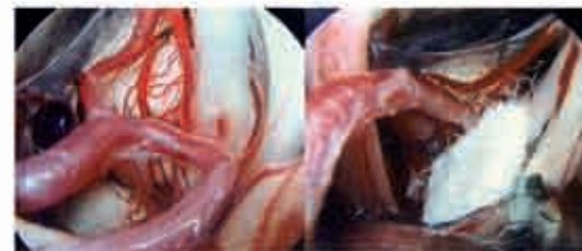
Illustration d'un conflit par la pica. A gauche on visualise l'artère qui vient au contact du nerf facial. A droite la pica est mobilisée et un fragment de téflon est mis en place pour isoler le nerf facial.

Illustration d'un spasme lié à un conflit provoqué par une artère (pica). A gauche, avant mobilisation artérielle; à droite, après décompression, on visualise nettement l'artère vertébrale (AV), la pica et l'empreinte sur le nerf facial. Un téflon (en blanc) a été interposé de manière à isoler cette zone de conflit.