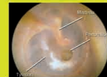
Perforation centrale du tympan, de petite taille, séquelle d'otites à répétition

En cas de notion d'existence d'une perforation ou d'une déchirure connue du tympan il est nécessaire de consulter un médecin avant toute tentative de nettoyage par soi-même. En effet l'instillation de gouttes auriculaires en cas de perforation tympanique peut générer certaines complications selon le type de gouttes, dont certaines peuvent s'avérer toxiques pour l'oreille. Par ailleurs l'instillation d'eau passant à-travers une perforation peut également être responsable d'otite aiguë.