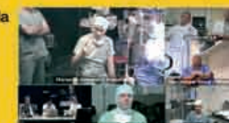
Table ronde multicentrique Hannover, Marseille, Beziers, Manchester, Amsterdam, Londres

Ce r seau permet  galement la formation   distance des internes et chefs de clinique gr ce   une session pilote hebdomadaire de vid o-conf rence entre la clinique Causse et le CHU de Utrecht.