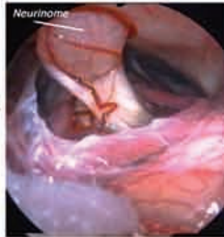
Vue opératoire sous endoscope montrant le neurinome

■ Chirurgie: Le choix de la technique chirurgicale (voie d'abord) dépend de la taille de la tumeur et de l'importance de la surdité. La résection complète de la tumeur sans séquelle neurologique et avec conservation de l'audition est le but ultime de la chirurgie mais le plus souvent l'audition ne peut être préservée.