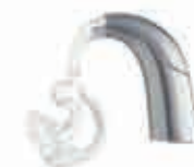
Appareil en contour d'oreille

Les appareils par voie osseuse peuvent être des vibreurs placés dans des branches de lunette, ou des appareils à ancrage osseux qui font partie des appareils implantables .