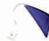
Appareil en contour à écouteurs déportés

à écouteurs déportés), ou d'un processeur placé derrière l'oreille, prolongé par un tube et un embout placé dans le conduit auditif (contours d'oreille).